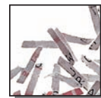
Coupe croisée 2 x 15 mm Niveau de sécurité DIN 4 Documents confidentiels ou secrets.