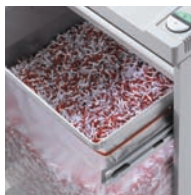
Cadre porte-sac sur glissières télescopiques