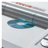
Destruction de cédéroms