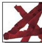
Coupe croisée 4 x 40 mm Niveau de sécurité DIN 3 Documents confidentiels.